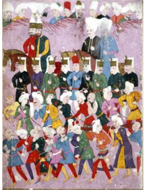
Η απεικόνιση του παιδομαζώματος σε Οθωμανική Γκραβούρα