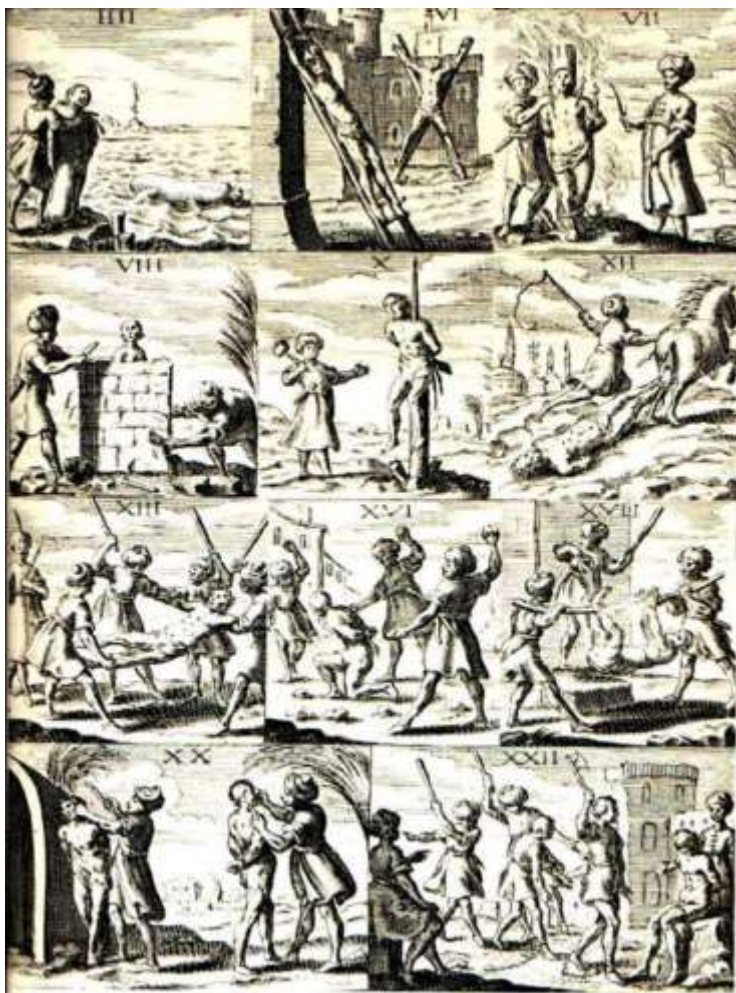
Ευρωπαϊκή Γκραβούρα για την ζωή των Γενιτσάρων

1. Η βίαιη αφαίρεση των χριστιανών αγοριών 8-12 ετών από τις οικογένειές τους γίνεται περιοδικά για κάθε γεωγραφική περιοχή, ανάλογα με τις στρατιωτικές ανάγκες του κράτους, από ειδικά εντεταλμένους αξιωματικούς. Η διαδικασία αυτή διαρκούσε αρκετούς μήνες και ξεκινούσε με βάση τα αρχεία των βαπτίσεων κάθε χριστιανικής κοινότητας. Ο αριθμός των αγοριών που αφαιρούνταν από τις οικογένειές τους εξαρτιόταν από τον πληθυσμό της περιοχής και τις εντολές της κεντρικής διοίκησης. Η διαδικασία της επιλογής των αγοριών βασιζόταν σε κανόνες που καθόριζαν τα χαρακτηριστικά των αγοριών που θα ενταχθούν (π.χ μέτριο ύψος, ευφυΐα σωματική διάπλαση) στο παιδομάζωμα (δείτε στο Παράρτημα τους σχετικούς κανονισμούς). Η όλη η διαδικασία καταγράφονταν σε ειδικά βιβλία σε δύο αντίγραφα. Το παιδομάζωμα εφαρμοζόταν σε όλους τους χριστιανικούς πληθυσμούς όπως τους Έλληνες, Βούλγαρους, Σέρβους, Αρμενίους κτλ, ενώ οι Εβραίοι εξαιρούνταν από το μέτρο. Επίσης, εξαίρεση αποτελούσε η υπαγωγή των πρόσφατα εξισλαμισμένων Βοσνίων στο σύστημα Ντεβσιρμέ.