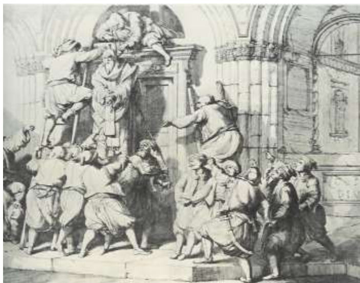
Ο απαγχονισμός του Οικουμενικού Πατριάρχη Γρηγορίου Ε' από τους Γενιτσάρους ημέρα Πάσχα του 1821

Σημαντικό στοιχείο που απορρίπτει τη θεωρία περί της εύνοιας των Χριστιανών για την εφαρμογή του Ντεβσιρμέ, είναι οι προσπάθειές τους να γλιτώσουν τα αγόρια τους (γάμος σε μικρές ηλικίες, προσποίηση ασθένειας, δωροδοκία των αρμοδίων κτλ.) και τα αυστηρά μέτρα που λαμβάνονταν για την αποφυγή δραπετεύσεων τόσο κατά την μετάβαση των ομάδων παιδιών στην Πόλη όσο και στη συνέχεια κατά τη διάρκεια της προετοιμασίας ένταξής τους στο σώμα των Γενιτσάρων. Κατά τους ισχύοντες νόμους, η ανακάλυψη γονέων που δεν παρέδιδαν τα παιδιά τους, συνεπαγόταν τον απαγχονισμό όλων των μελών της οικογένειας στην είσοδο της οικίας τους.