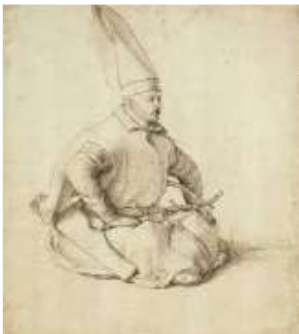
Πίνακας ζωγραφικής του Bellini την εποχή του Σουλτάνου Μεχμέτ Β΄

Όπως συμβαίνει σε αρκετά θέματα κρατικής οργάνωσης, το Οθωμανικό κράτος επηρεάστηκε και σε αυτό το θέμα από το Σουλτανάτο των Σελτζούκων του Ρουμ, που εγκαθιδρύθηκε συνεπεία της ήττας της Βυζαντινής Αυτοκρατορίας στη μάχη του Ματζικέρτ (1071) και κυριάρχησε στο κεντρικό οροπέδιο της Μικράς Ασίας από τα τέλη του 11ου μέχρι και τα τέλη του 13ου αιώνα. Οι Σελτζούκοι σε περιορισμένη κλίμακα είχαν εντάξει στην κρατική τους οργάνωση, ως στρατιώτες ή γραφειοκράτες, χριστιανούς αιχμαλώτους που δέχονταν να εξισλαμιστούν. Αυτοί ονομάζονταν «Γκουλάμ».